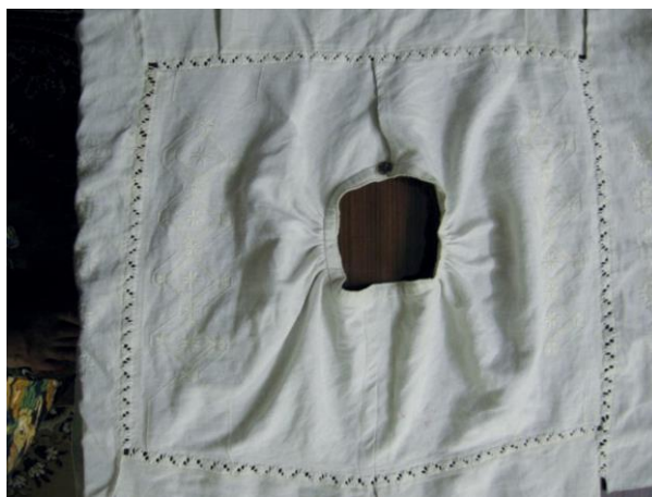
Фото 16. Змережування мережкою «шабак» частин кодацької сорочки. Виконання Г. Хмель-Дунай