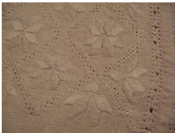
Фото 2. Геометрична вишивка восьмипелюсткової квітки