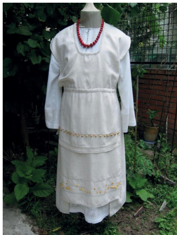
Фото 9. Сучасний стилізований український одяг. Виконання Г. Хмель-Дунай