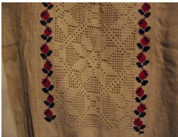
Фото 1. Перехідний період в українській вишивці: брокарівський хрестик та традиційна українська мережка