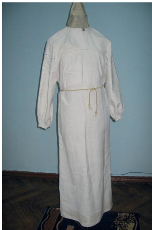
Фото 13. Відтворена кодацька сорочка. Виконання Г. Хмель-Дунай