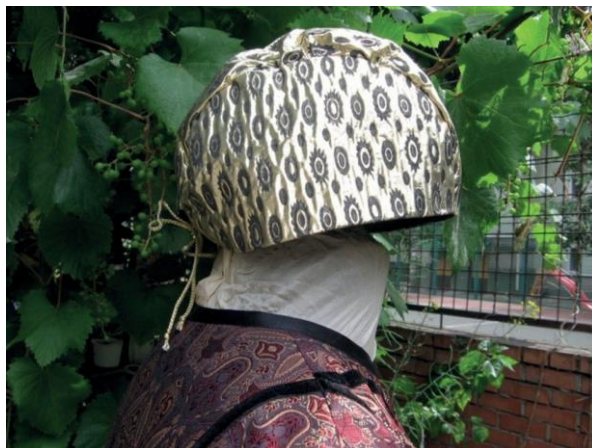
Фото 11. Жіночий головний убір — очіпок. Виконання Г. Хмель-Дунай