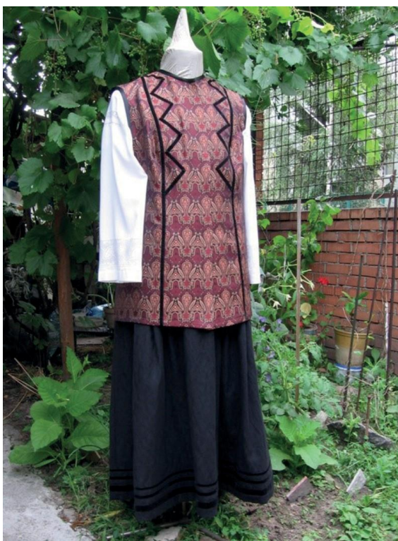
Фото 8. Відтворення однострою заможної жінки кінця XIX — початку XX ст. Виконання Г. Хмель-Дунай