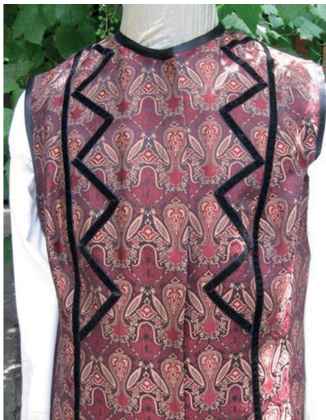
Фото 10. Жіноча керсетка з парчі оздоблена оксамитовою стрічкою. Виконання Г. Хмель-Дунай