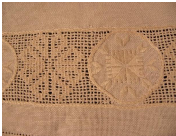
Фото 15. Вишивка поділок технікою «письмо» та мережкою з настилом. Виконання Г. Хмель-Дунай