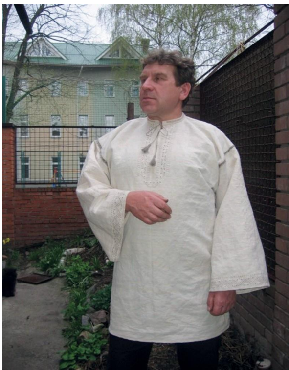
Фото 17. Чоловіча лоцманська сорочка. Виконання Г. Хмель-Дунай