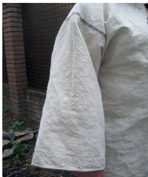
Фото 18. Вишивка «дерева життя» на рукаві лоцманської сорочки. Виконання Г. Хмель-Дунай