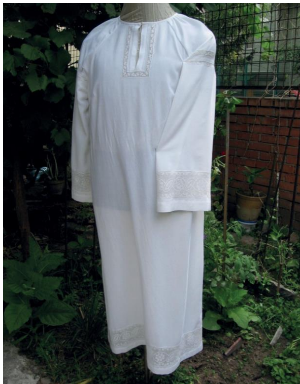
Фото 7. Сучасна реконструкція додільної сорочки автентичного історичного артефакту. Виконання Г. Хмель-Дунай