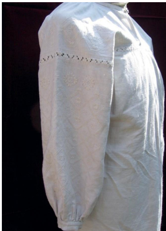
Фото 14. Вишивка на рукаві кодацької сорочки. Виконання Г. Хмель-Дунай