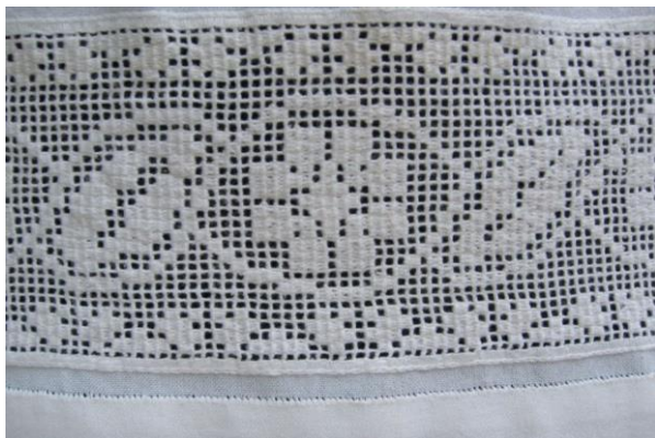
Фото 6. Той же малюнок на поділках сорочки на сучасній тканині. Виконання Г. Хмель-Дунай