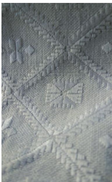
Фото 3. Видозмінена квітка з тризубами, зустрічається у вишивках Дніпропетровщини, Полтавщини. Виконання Г. Хмель-Дунай