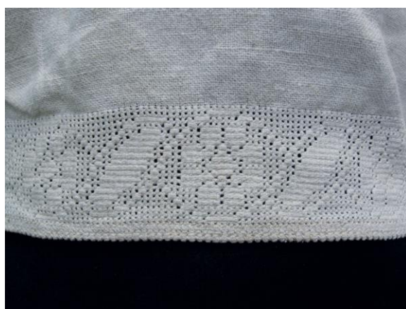
Фото 5. Вигляд поділок сорочки з автентичною вишивкою