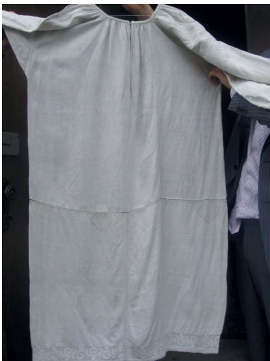
Фото 12. Кодацька сорочка — трипілка